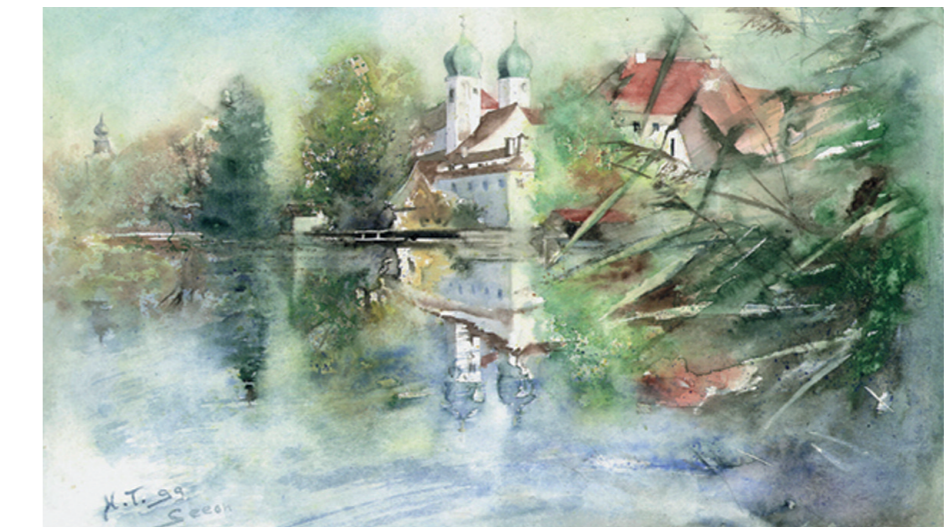
Bildnachweis: Aquarell (auch Titelbild) Hans Torwesten, Kienberg, www.atelier-torwesten.de